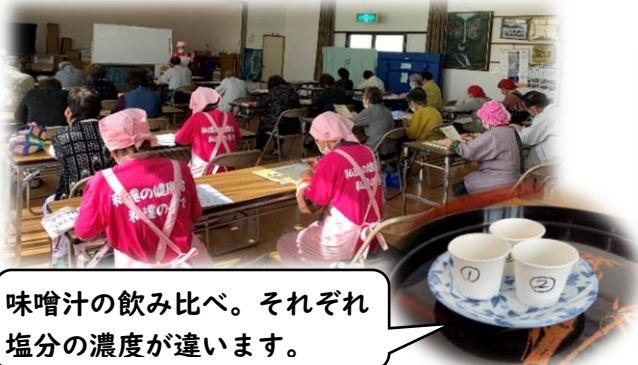
味噌汁の飲み比べ。それぞれ塩分の濃度が違います。