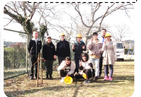
記念植樹あとの集合写真