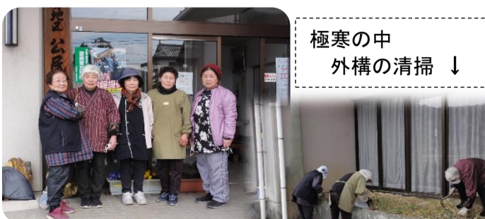
極寒の中 外構の清掃 ↓

作業の量と差し上げる謝礼とが全く不釣り合いで、ほぼボランティアの条件にも拘わらず、永年に亘り担当願っています。感謝と敬服の意を込めご紹介させていただきます。