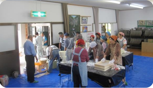
↑役員有志と女性ボランティアで5,000個の小餅づくり