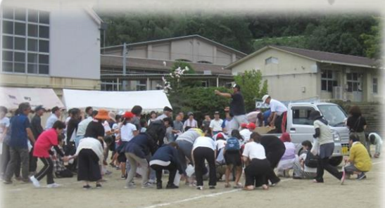
↑参加者全員で盆踊り ←みんな楽しいモチマキ