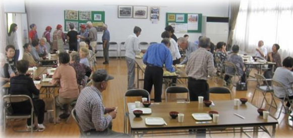
→ ふれあいサロンでのバイキング昼食