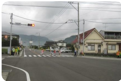
秋の交通安全運動