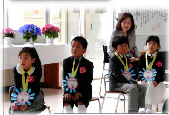
少し緊張気味の新入生